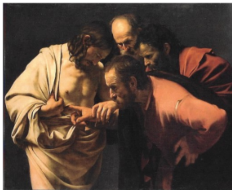
(Caravaggio) MUSIK ZUM EINZUG