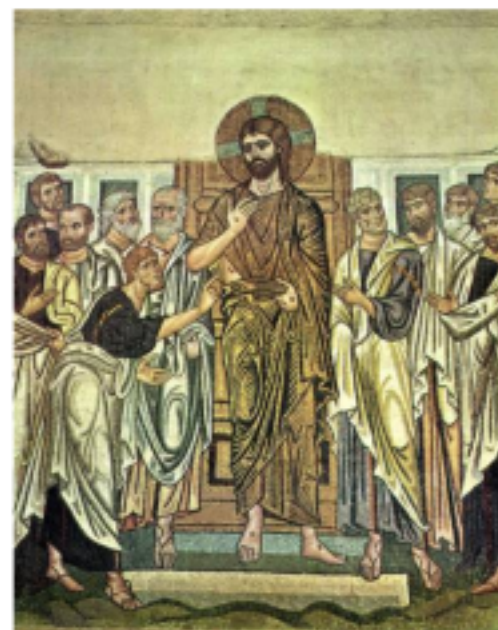
( Daphne-Kloster in Athen)

am Sonntag 5. 5. ist um 10 Uhr Wort-Gottes-Dienst , Pfr. Koeppen. anschließend Kirchengemeindeversammlung EKIG- RJP im Gemeindehaus für alle Kirchenmitglieder.